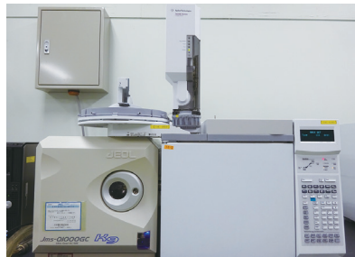
● ガスクロマトグラフ/ 四重極型質量分析装置(GC/QMS)