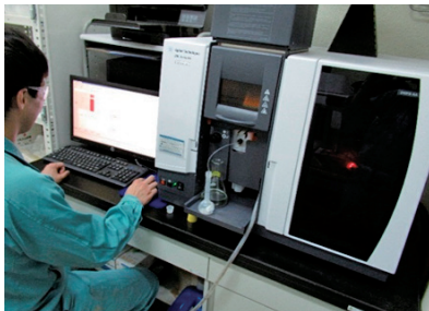
● 原子吸光分析装置